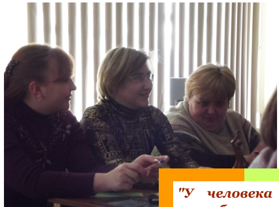
Члены жюри конкурса

О том, кто такие трубадуры и менестрели, а также, как распределились места, читайте НИЖЕ