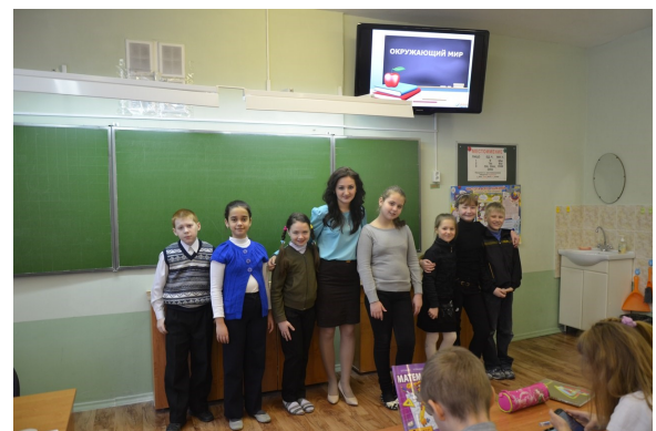
Ученикам очень нравятся уроки наших студентов

ПОДРОБНЫЙ ФОТООТЧЕТ НА СЛЕДУЮЩЕЙ СТРАНИЦЕ