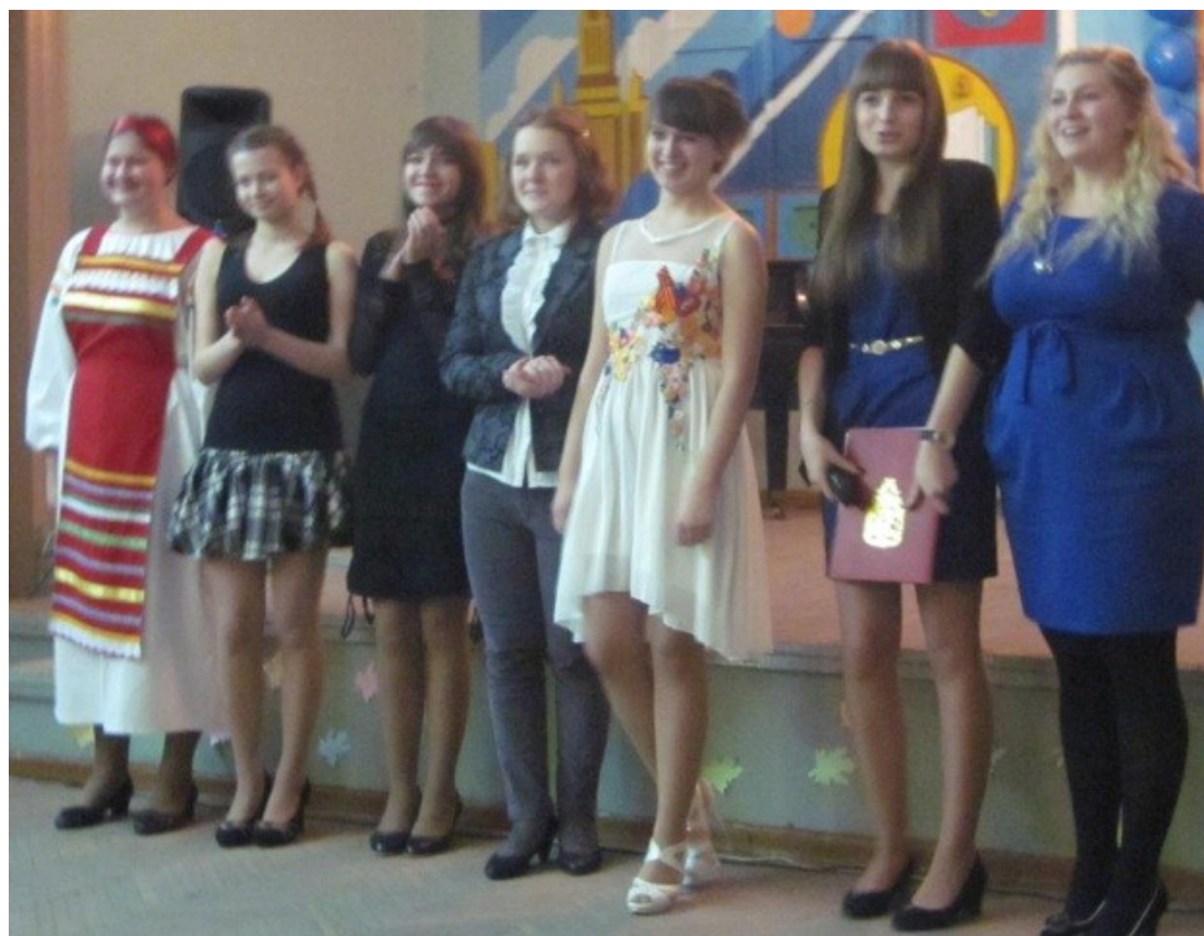
Артисты и ведущие мероприятия